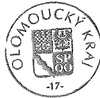
Ing. Zdeněk Švec náměstek hejtmána Olomouckého kraje